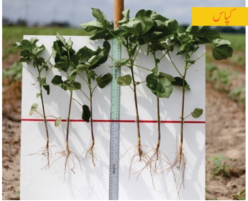
پاپلیٹس کے استعمال کے بغیر