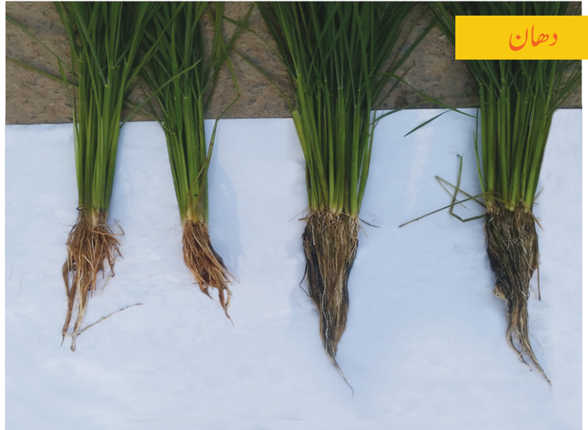
پاپلیٹس کے استعمال کے بغیر