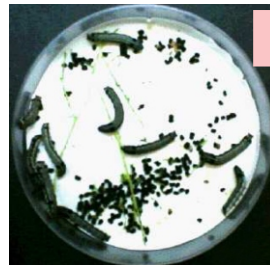
غیر اسپرے شدہ