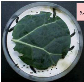
تا کومی سے اسپرے شدہ

تا کومی کپاس، گوبھی، پھول گوبھی اور ٹماٹر میں نہایت کامیابی سے استعمال